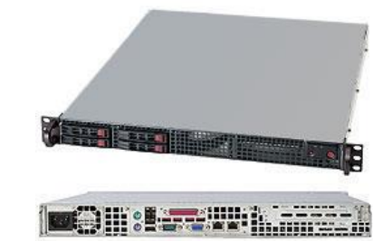
【ラックマウント型(1U):FDC T1W】